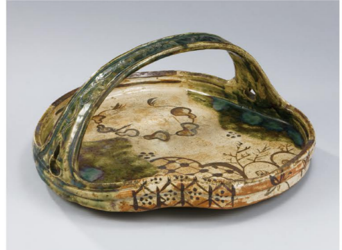
織部手鉢 瀬戸蔵ミュージアム蔵

入館料:大人500円(400円)、高大生300円(240円) ※20名以上の団体は( )内の入館料 ※中学生以下、65歳以上、妊婦、障害者手帳をお持ちの方は無料